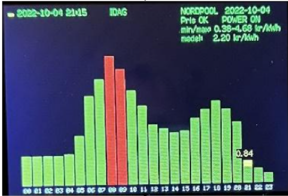
Dagens timpriser Aktuellt pris och blockerade timmar